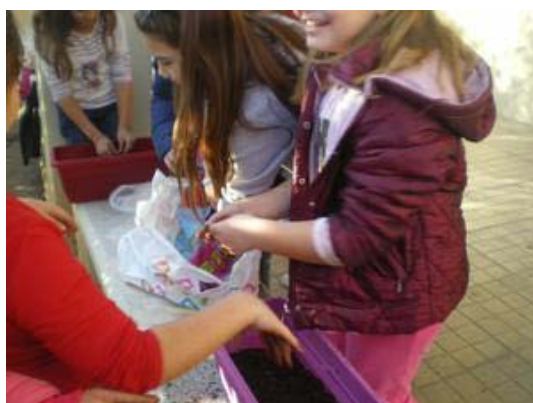
Προετοιμασία ζαρντινέρας για φύτεμα