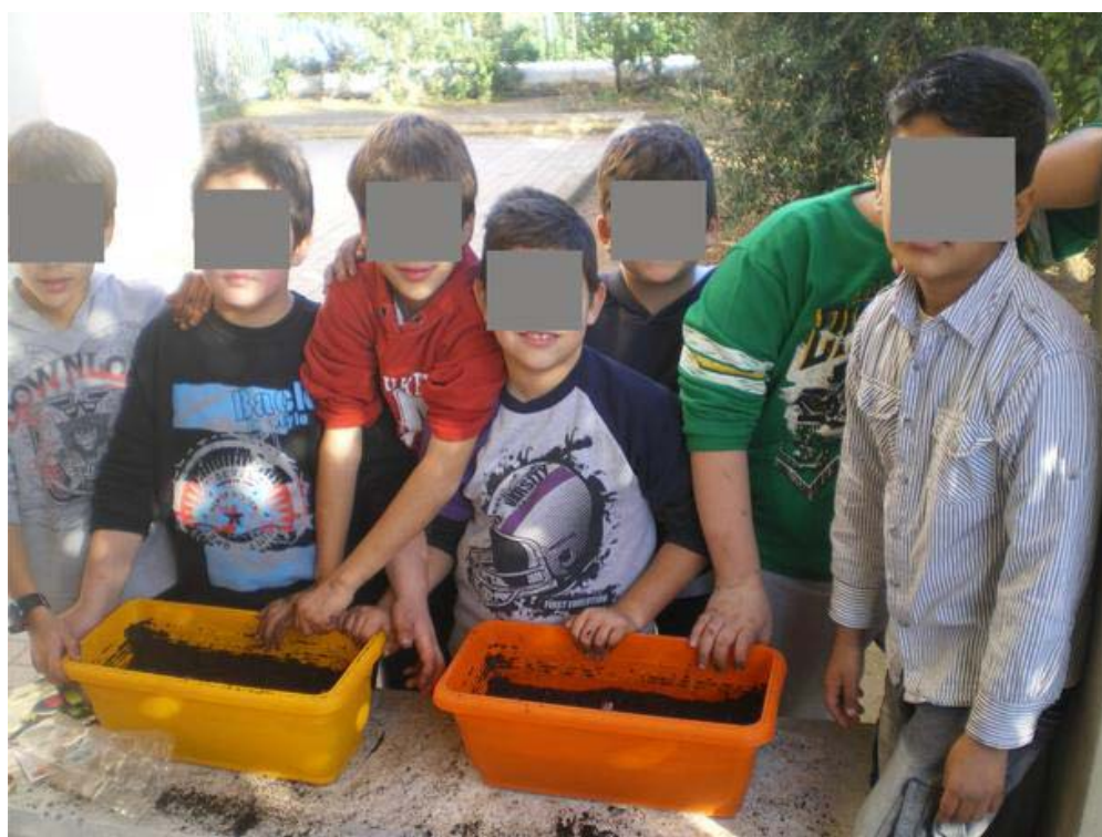
Οι ομάδες καμαρώνουν το έργο τους