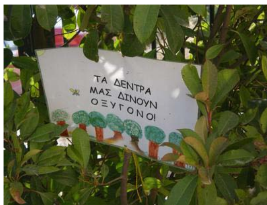
Ενημερωτικές πινακίδες στον κήπο