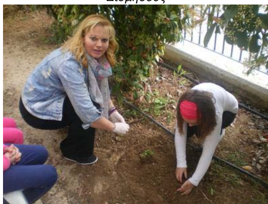
Φύτεμα στο χώμα