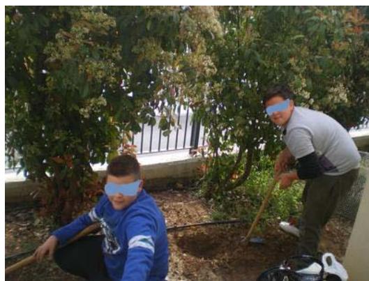
Σκάψιμο με ειδικά εργαλεία