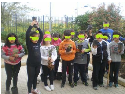
Γνωριμία με τα φυτά από τον Βοτανικό Κήπο Διομήδους