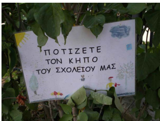
Οι πινακίδες δίνουν οδηγίες...