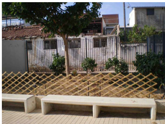
Το ξύλινο διαχωριστικό του κήπου μας!