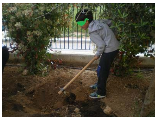
Κοίτα πόσο βαθιά λακούβα έσκαψα!