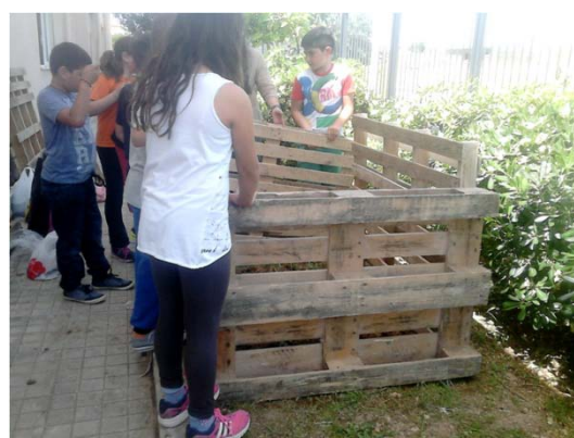
Παιδιά, ο κομποστοποιητής μας σε λίγο θα είναι έτοιμος!