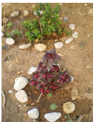
Δυόσμε, θέλεις να κάνουμε παρέα;