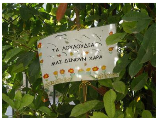
Εκφράζουμε τα συναισθήματά μας!