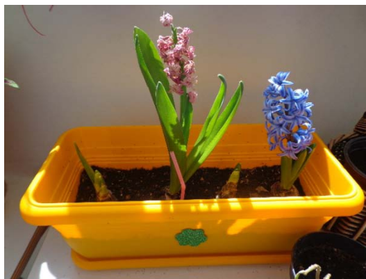
Ζαρντινέρα με ζουμπούλια στο διάδρομο