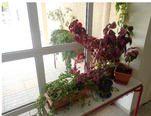
Ομορφαινουμε την είσοδο του σχολείου!