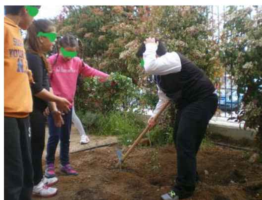
Σκάψιμο με τη σειρά