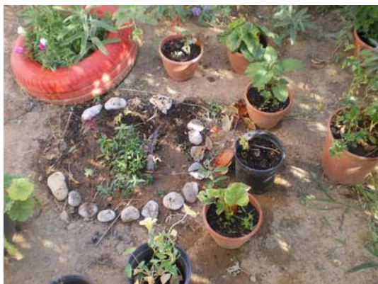
Μια ωραία συντροφιά!