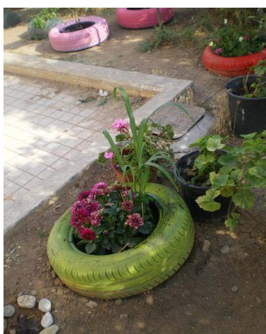
Ωραίος συνδυασμός χρωμάτων!