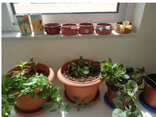
Γλάστρες, πήλινα και τενεκεδάκια σε παράταξη