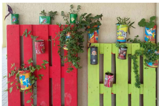
Δίνουμε νέα ζωή στα παλιά αντικείμενα!