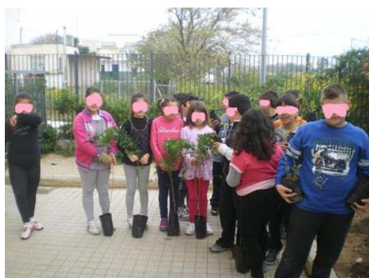
Έτοιμοι για μεταφύτευση στον κήπο