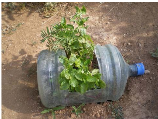
Βόλτα στον κήπο!