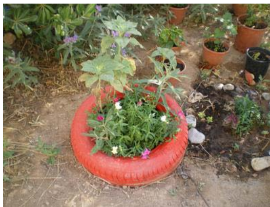
Πρωτότυπα παρτέρια στον κήπο μας!