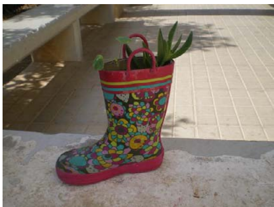
Ακόμα και στα παλιά μας γαλοτσάκια!