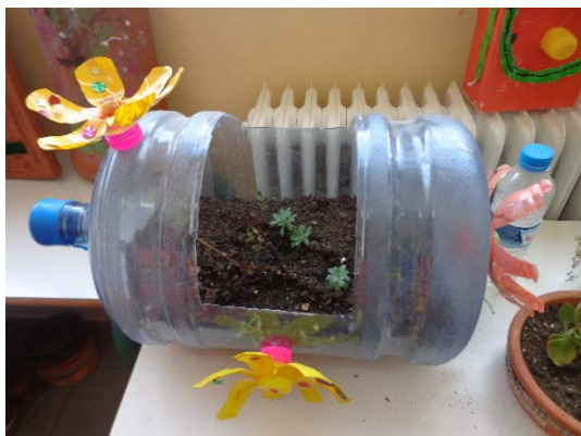
Επαναχρησιμοποιούμε δημιουργικά και πλαστικές μπουκάλες νερού