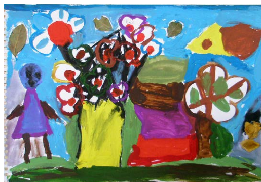
Μαθητικές δημιουργίες