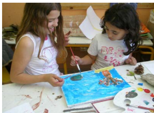
Οι μαθητές συνεργάζονται και δημιουργούν με διάφορα υλικά